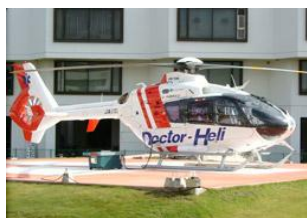
胴体全長は10.2m, 最大時速254km

単なる救急搬送ではなく、現場で迅速に救急医療を始めることが最大の目的。医師と看護師など操縦士を含め6名が乗る。2011年現在、全国で28事業所。年間約2億円かかる費用は国と県が負担。愛知県での運行管理は中日本航空(株)が担当している。活動範囲は片道70Km圏内(25分) ... 愛知医科大学病院HPより