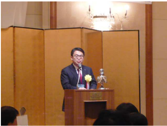
大村 秀章 愛知県知事