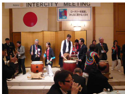
アトラクション 吉良和太鼓クラブ「華龍音」