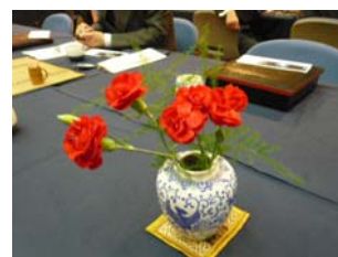
例会場卓上花（スプレーカーネーション・ミリオンズパ®ラ）