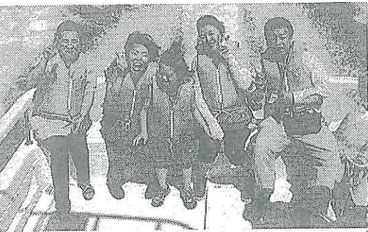
クルージングを体験するダウン症児ら

25と26の2日間のプログラム。参加者はラグーナ蒲郡でトヨタ紡織所有のクルーザーでクルージング(周遊航海)を体験。宿泊先の三ヶ日保養所(浜松)