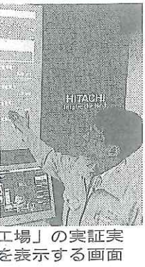
工場の実証実験の画面を表示する

NECは7月にオフィス敷地内の太陽光発電や店舗向けのサービスを開始した。配電盤に消費電力を、コンピュータや室温を感知するセンサー