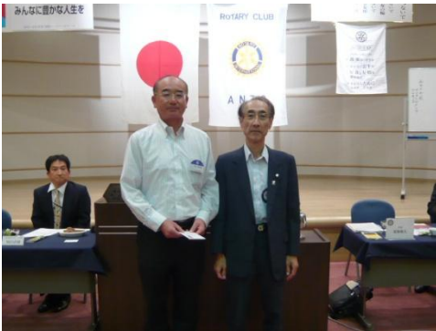
安城少年野球連合会へ活動費の贈呈