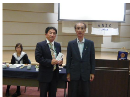
安城学園高校インターアクトクラブへ活動費の贈呈

海外派遣は、3分の1を安城ロータリークラブ、3分の1を地区ロータリークラブ、残りの3分の1を家庭という費用負担で行くことができます。このような寄付をいただき、生徒が貴重な体験ができることに感謝しています。