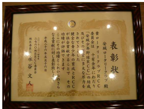
♪ 地区RCC委員長より表彰されました ♪