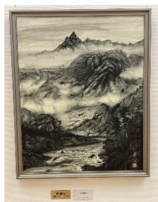
「高遠山水」杉山華仙氏作