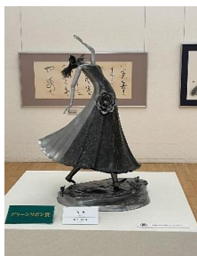
「情炎」松井宗太郎氏作