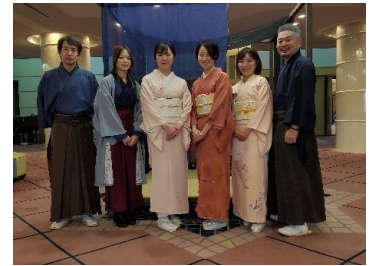
名古屋芳心会の皆様 初釜