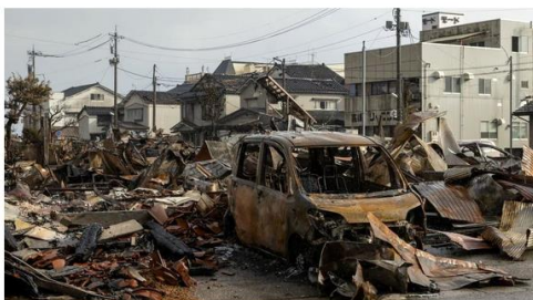
石川県輪島市の朝市通りは地震によって発生した火災によって広い範囲が焼け落ちた